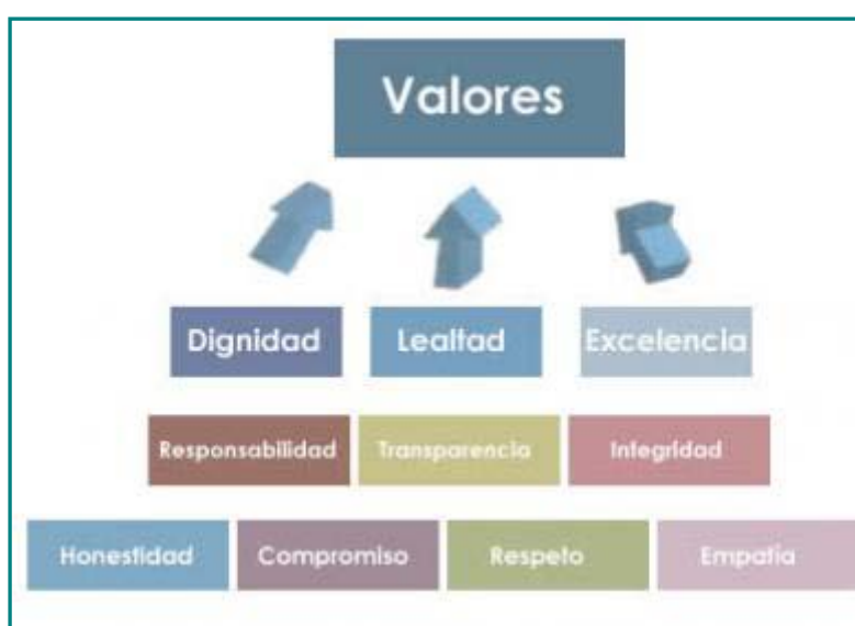
Pie: Los valores de la educación.

Los valores se sitúan en pie de igualdad con los contenidos disciplinares convirtiéndose así en objetos de enseñanza y aprendizaje .