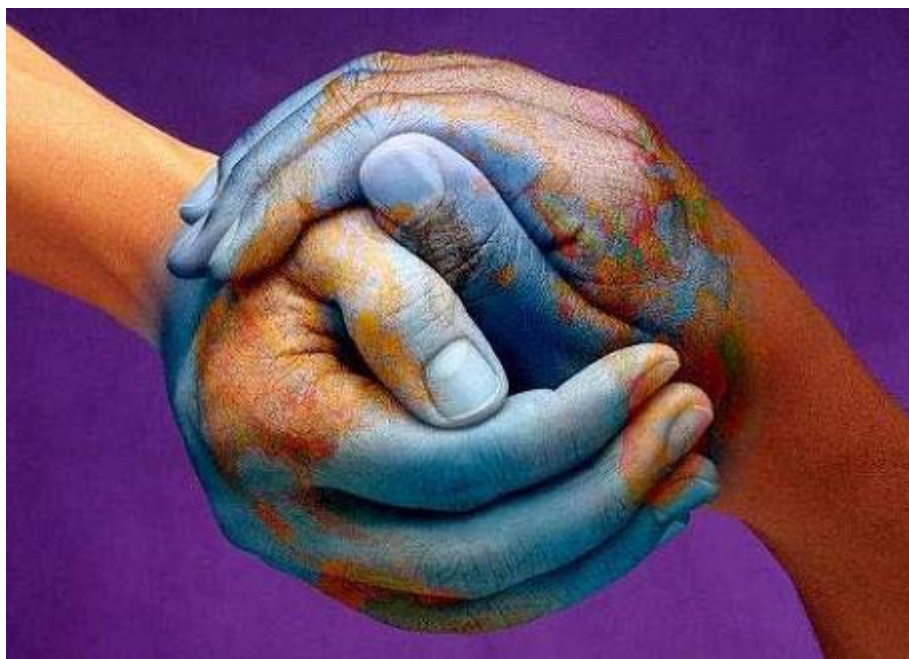
PIE: La formación en valores tarea de todos

Las sociedades actuales conceden gran importancia a la educación que reciben sus jóvenes, en la convicción de que de ella dependen tanto el bienestar individual como el colectivo. La educación es el medio más adecuado para construir su personalidad, desarrollar al máximo sus capacidades, conformar su propia identidad personal y configurar su comprensión de la realidad, integrando la dimensión cognoscitiva, la afectiva y la axiológica. Para la sociedad, la educación es el medio de transmitir y, al mismo tiempo, de renovar la cultura y el acervo de conocimientos y valores que la sustentan, de extraer las máximas posibilidades de sus fuentes de riqueza, de fomentar la convivencia democrática y el respeto a las diferencias individuales, de promover la solidaridad y evitar la discriminación, con el objetivo fundamental de lograr la necesaria cohesión social. Además, la educación es el medio más adecuado para garantizar el ejercicio de la ciudadanía democrática, responsable, libre y crítica, que resulta indispensable para la constitución de sociedades avanzadas, dinámicas y justas. Por ese motivo, una buena educación es la mayor riqueza y el principal recurso de un país y de sus ciudadanos y ciudadanas.